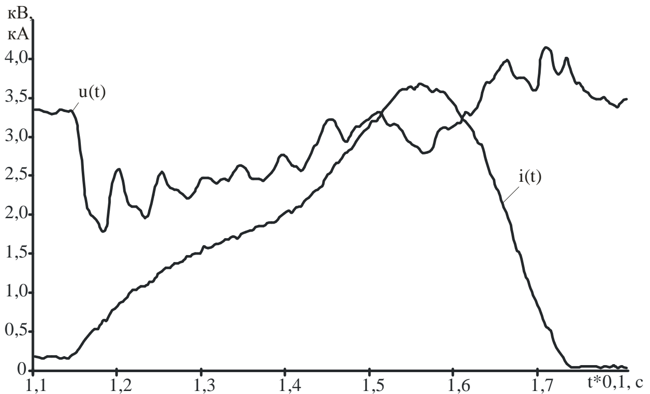
Рис.1. Тимчасові залежності фідерної напруги і струму однієї з тягових підстанцій Придніпровської залізниці в режимі КЗ

Наведені вище міркування про ПЯЕ відносяться і до енергетичних характеристик (показників) системи електротяги і, зокрема, до коефіцієнта потужності I , і до коефіцієнта реактивної потужності tgj .