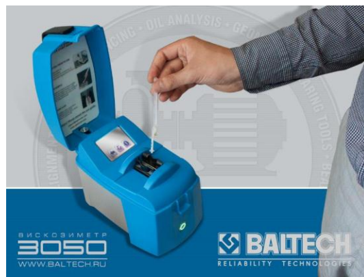
Рис. 4. ІЧ- аналізатор 1100

Даний прилад дозволяє визначати такі важливі характеристики масла, як обсяг води, загальне лужне число, загальне кислотне число, вміст сажі, гліколя, присадок і окислення масла. Крім того, він не вимагає застосування розчинників і пробопідготовки, характерних для класичного лабораторного ІЧ - аналізу. За допомогою ІЧ – аналізатора 1100 можливо отримати інформацію про критичний стан масла за 2 хвилини. Як правило, в комплекті з переносним ІЧ - аналізатором 1100 слід застосовувати портативний віскозиметр 3050, який дозволяє визначати кінематичну в'язкість масла (одного з основних показників масла) також на робочому місці і мати, таким чином, повне уявлення про стан масла. Результати порівняння традиційної системи аналізу масла та сучасних методів наведені в табл. 2.