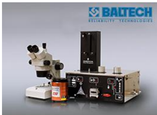
Рис. 3. Портативна міні лабораторія для аналізу трансформаторного масла

Особливо привабливо цей метод виглядає при виконанні переносного ІЧ – аналізатора 1100, пропонуваного даною компанією. Зовнішній вигляд ІЧ – аналізатора 1100 наведено на рис. 4.