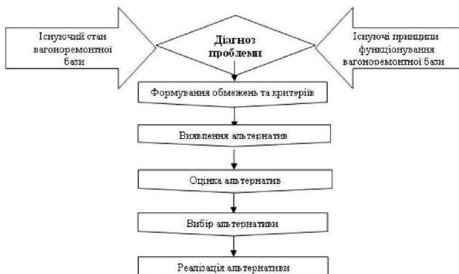
Рис. 1. Етапи раціонального вирішення проблеми

У табл. 1 наведено перелік вантажних вагонів за роками побудови.