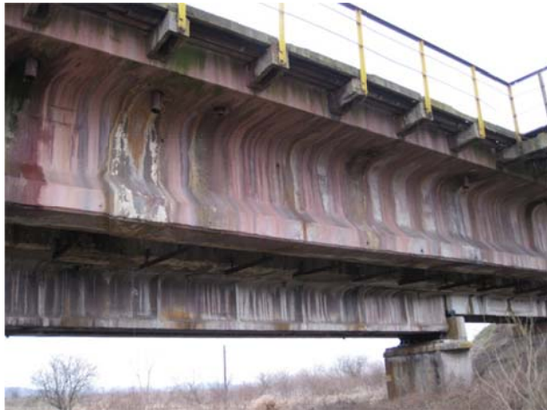
Рис. 4. Зміна забарвлення бетоном по усій поверхні залізобетонної прогонової будови

На усіх мостах виявлено ознаки біологічної корозії бетону. Це такі як зміна забарвлення бетоном по усій поверхні залізобетонної прогонової будови (рис. 4), патьоки зеленкуватого, чорного і інших кольорів у місцях підвищеної вологості (рис. 5), нарости моху та кристалізація продуктів життєдіяльності бактерій на поверхні бетону (рис. 6) і ін.