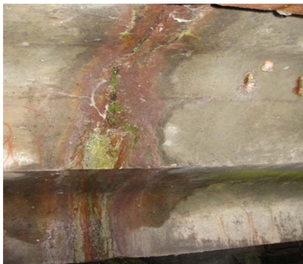
Рис. 5. Ознаки біологічної корозії бетону у місцях підвищеної вологості

Аналізуючи дефекти наведені на рис. 4, 5 і 6 можна зробити висновок, що на поверхні і у середині бетону залізобетонних прогонових будов відбувається активний процес біологічної корозії, який супроводжується кристалізацією на поверхні бетону продуктів життєдіяльності мікроорганізмів. Такий процес є небезпечним, тому що може привести до порушення