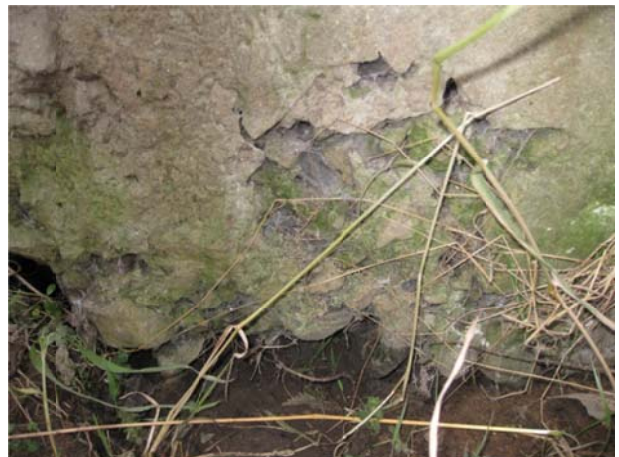
Рис. 7. Руйнування бетону проміжної опори у місці контакту із ґрунтом

Процес хімічної і біологічної корозії спостерігається і у місці контакту однієї із проміжних опор із ґрунтом (рис. 7).