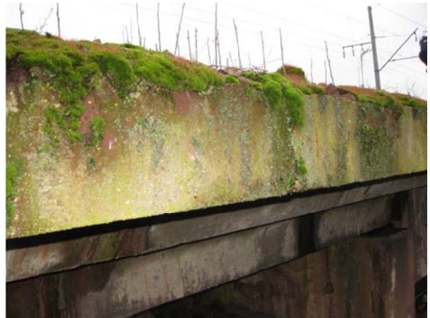
Рис. 6. Нарости моху та кристалізація продуктів життєдіяльності бактерій на поверхні бетону

зчеплення складових компонентів бетону і його руйнування.