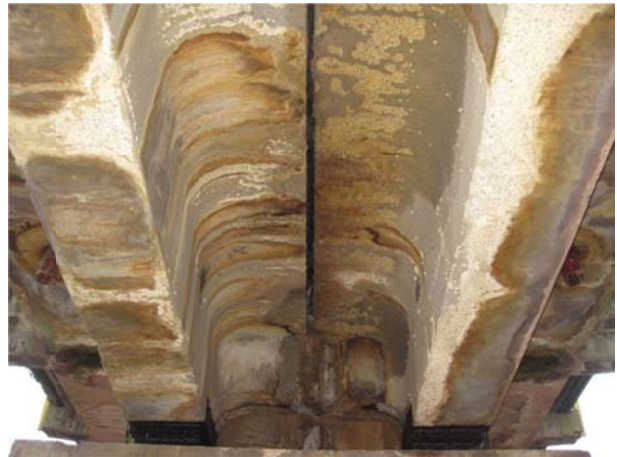
Рис. 2. Іржаві патьоки на внутрішній поверхні плити баластового корита та ребер залізобетонних прогонових будов

Характер патьоків на внутрішній поверхні плити баластового корита та ребер залізобетонних прогонових будов дозволяє зробити висновок, що відбувається просочування води не тільки скрізь розладнання у зазорі а і скрізь бетон плити баластового корита.