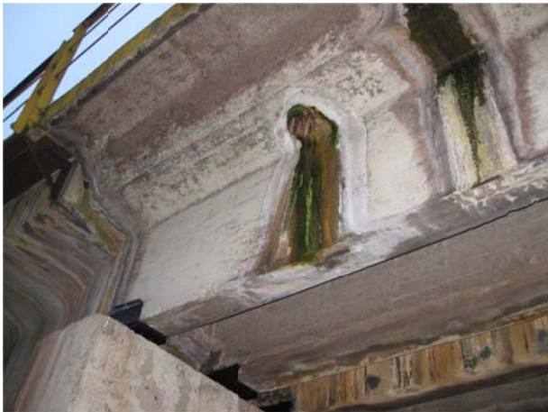
Рис. 1. Патьоки вилуговування на поверхні залізобетонних прогонових будов

Усі прогонові будови мають зруйновані іржею водовідвідні трубки. Внаслідок чого вода із плити баластового корита просочується навколо зруйнованих трубок попадає на бокову поверхню ребра прогонової будови і суцільною смугою стікає по поверхні (див. рис. 1). Враховуючи той факт, що дані мости експлуатуються на під'їзних колях підприємства хімічної промисловості, зрозуміло, що на поверхню баласту попадають речовини, пов'язані із виробничим процесом підприємства, а потім ці речовини розчиняються у воді під час дощів та просочуються через баласт і зруйновані водовідвідні трубки на конструкції прогонової будови. В результаті дії забрудненої води у бетоні відбувається процес хімічної та біологічної корозії. Про що свідчать різні кольори забарвлення цих патьоків: чорний та зелений, відтінки коричневого і ін.