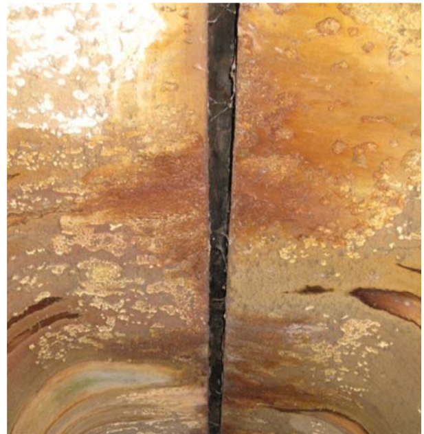
Рис. 3. Нашарування кристалізації хімічних речовин на внутрішній поверхні плити баластового корита

Ще одним наслідком просочування брудної води крізь бетон плити баластового корита є утворення на внутрішній поверхні плити нашарувань кристалізації хімічних речовин внаслідок хімічної корозії бетону (рис. 3).