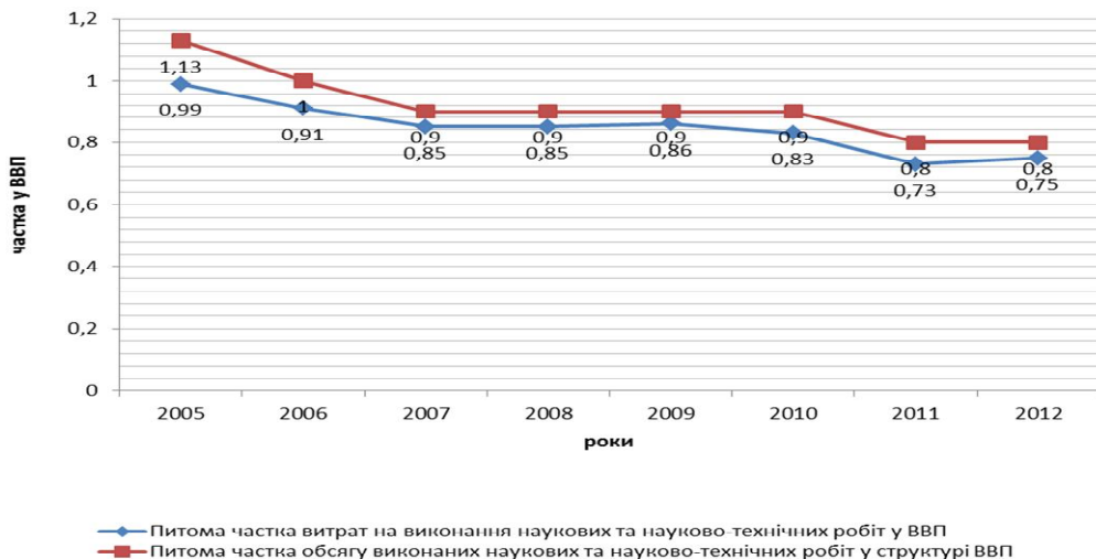
Рис. 2. Динаміка індексів співвідношення питомої частки витрат на виконання наукових та науково-технічних робіт та обсягу виконаних наукових та науково-технічних робіт у структурі ВВП