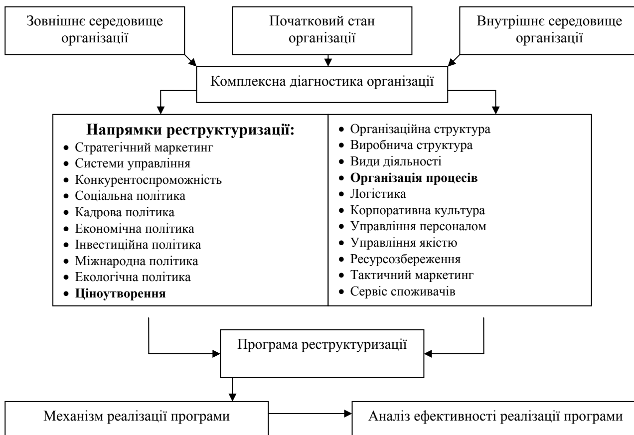
Рис. 1. Принципова схема реструктуризації підприємства

При дослідженні роботи приміського господарства в роботі застосовано системний аналіз, який відбувається на основі всебічного вивчення властивостей господарства із застосуванням наукових підходів для виявлення слабких та сильних сторін системи, її можливостей та погроз, формування стратегії функціонування та розвитку.