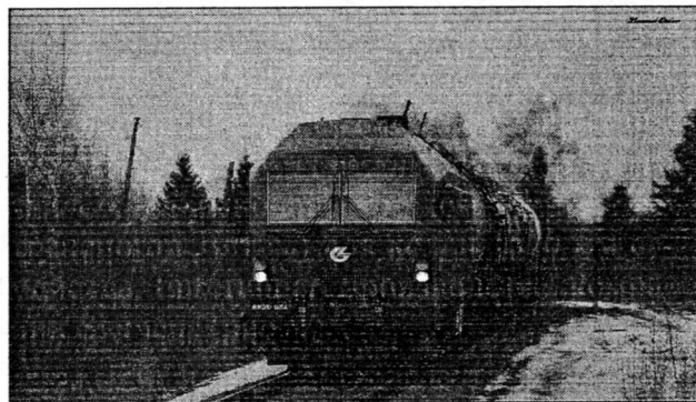
Рис. 1. Тепловоз ER20CF

Администрация АО «Литовские железные дороги» в поисках наилучших вариантов обновления тягового подвижного состава постоянно анализирует опыт мирового рынка, использует все возможные средства для технического обновления парка подвижного состава и инфраструктуры. Это и способствовало тому, что согласно Программы обновления парка тягового грузового подвижного состава [3] были разработаны тепловозы нового поколения ER20CF (так как дизельная тяга является основой железнодорожного транспорта Литвы) для колеи 1520 мм семейства Eurogunner производства компании Siemens (рис. 1).