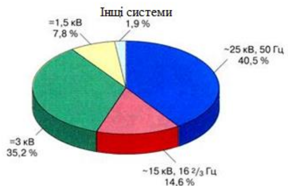
Рис. 3. Питома вага систем тягового електропостачання

Багатосистемні електровози і електропоїзди застосовують для забезпечення руху без зміни локомотивів по електрифікованих ділянках з різними системами електричної тяги, наприклад: постійного струму при напрузі 1500 і 3000 В, змінного струму з різними частотою і напругою, постійного струму і декількома системами змінного струму.