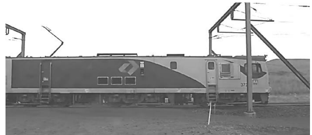
Рис. 4. Прохід електровозом зони струморозподілу над переїздом

Для запобігання пошкоджень контактної мережі, струмоприймачів і дахового устаткування електрорухомого складу замість нейтральних вставок на залізницях України рекомендується використовувати конструкцію струморозділу яка застосовується на залізницях Австралії над переїздами, де експлуатується негабаритний автомобільний транспорт.