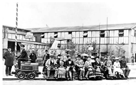
Рис. 1. Перша електрична залізниця

До теперішнього моменту загальна протяжність електричних залізниць у всьому світі досягла 200 тис. км, що становить приблизно 20 % загальної їх довжини. Як правило, це найбільш вантажонапружені лінії, ділянки зі складним профілем колії, приміські вузли великих міст з інтенсивним рухом поїздів.