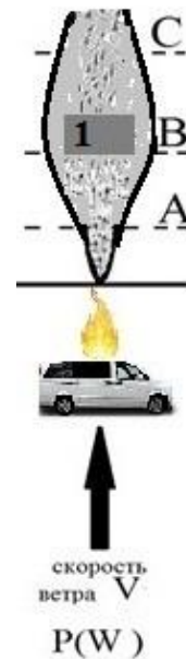
Рис. 1. Вероятность появления зон поражения для различных метеословий: 1 – здание

химически опасного вещества. При прогнозе нас интересуют те точки области в районе теракта, где концентрация химически опасного вещества превышает некоторое пороговое значение, при котором происходит та или иная степень поражения людей. Схематически на рис. 1 показана ситуация попадания рецепторов А, В, С под действие источника эмиссии (баллона, в котором находится токсичный газ), причем отметим, что выброс происходит в условиях застройки.