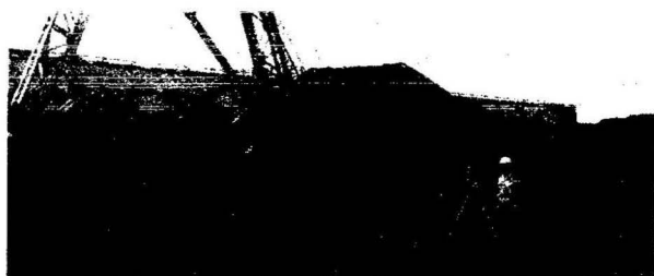
Рис. 1. Штабели угля /