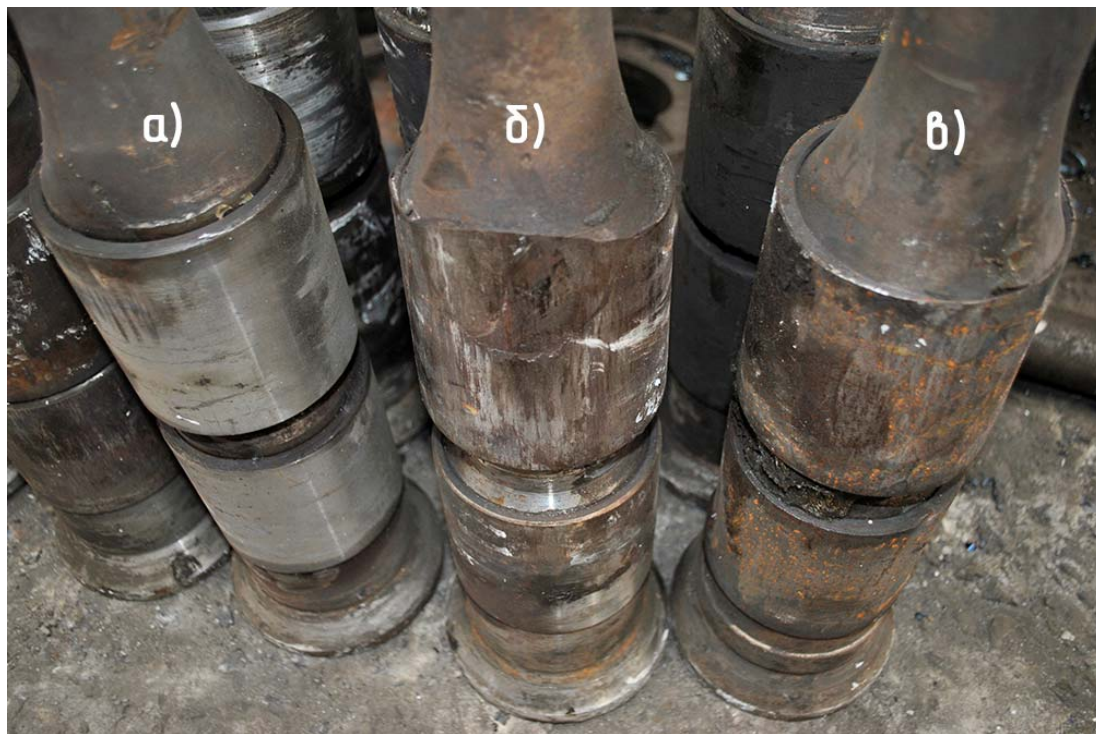
Рис. 4. Пошкодження стержнів і втулок коліскового підвішування кузова електровозів серій ВЛ11М, ВЛ80: а) стержень із новими втулками; б) стержень із надмірнозношеною втулкою та зношенням тіла стержня; в) зношення втулок стержня