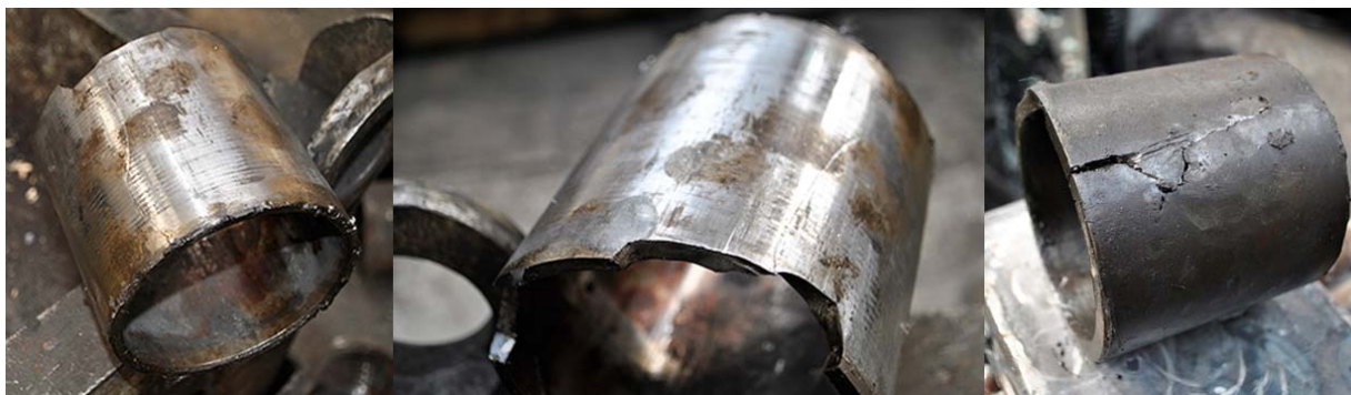
Рис. 5. Пошкодження втулок стержня коліскового підвішування кузова електровозів серій ВЛ11М, ВЛ80