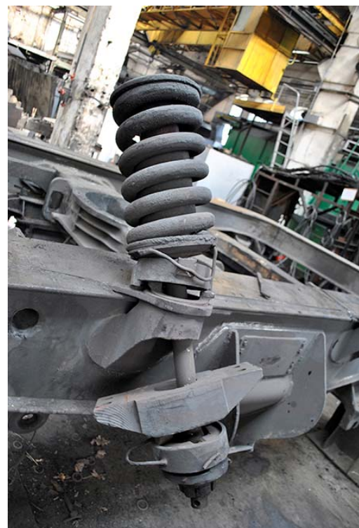
Рис. 2. Коліскове підвішування кузова електровозів серій ВЛ11м, ВЛ80

1 – кронштейн рами кузова; 2 – направляючий стакан; 3 – стержень підвішування; 4 – пружина; 5 – захисна втулка стакану; 6 – облицювальна втулка стержня; 7 – грибоподібна верхня опора пружини; 8 – опора верхнього шарніра; 9 – прокладка верхнього шарніра; 10 – нижня опора верхнього шарніра; 11 – боковина рами візка; 12, 14 – опори нижнього шарніра; 13 – прокладка нижнього шарніра